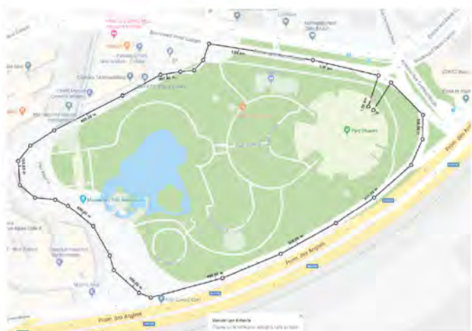
Parcours axes urbains