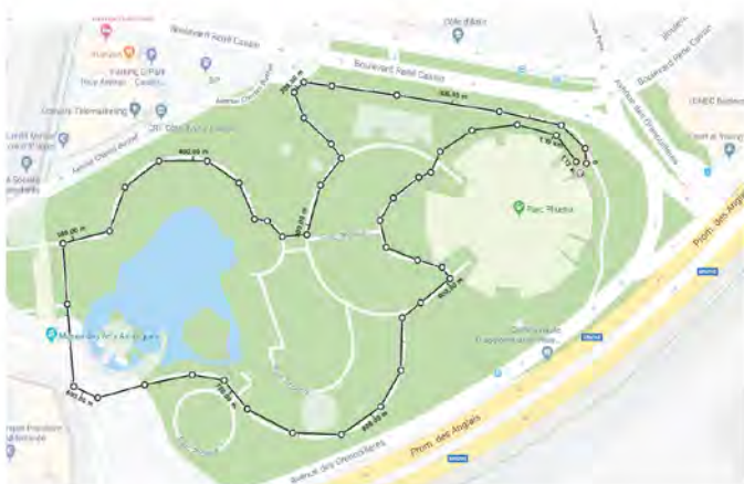
Parcours mobilité active