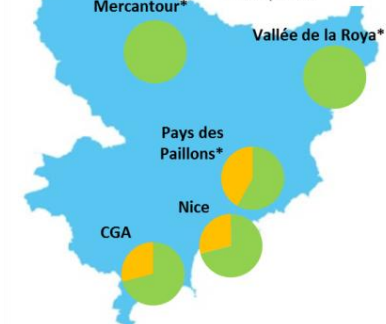
Répartition des indices en octobre

Que faire lors d'un épisode de pollution ? tous les bons gestes en cliquant sur ce lien