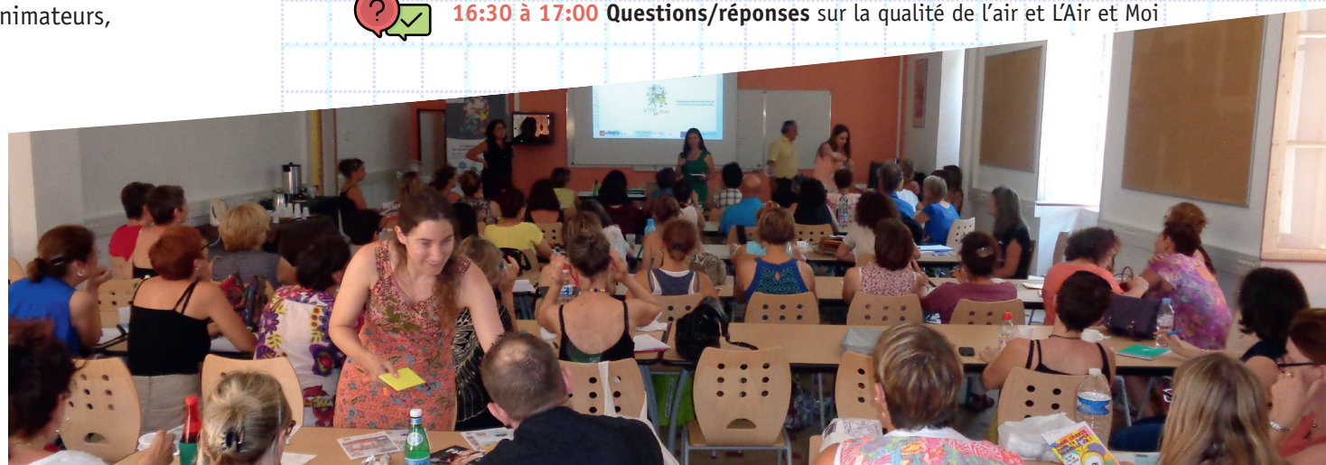
Formation de formateurs