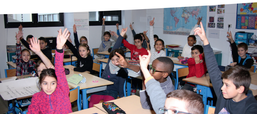
Animation L'Air et Moi en classe

Collectivités (services éducation, environnement, hygiène et santé, élus...), enseignants, associations, animateurs, et toute personne intéressée.