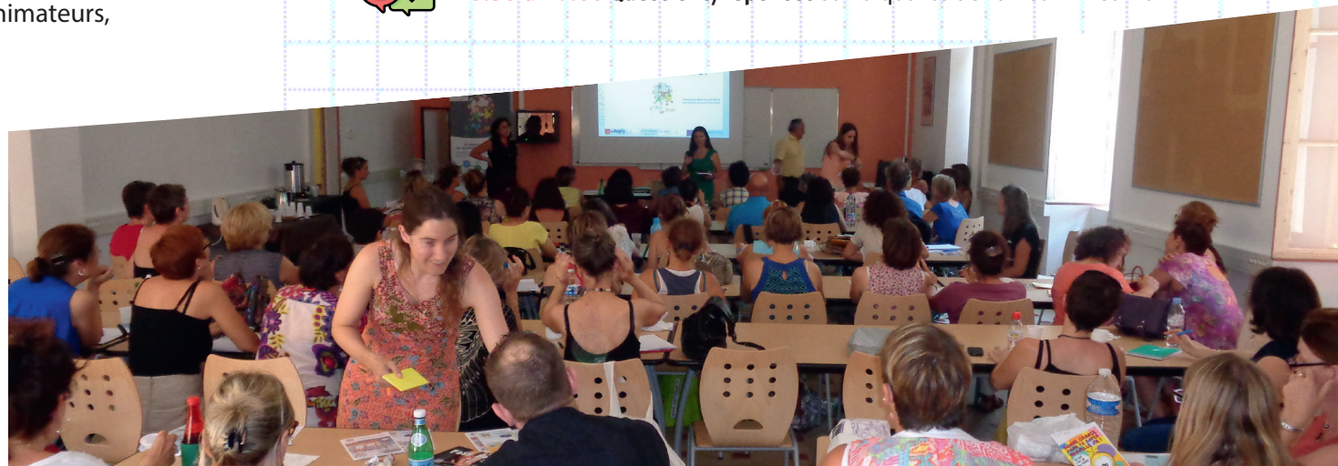
Formation de formateurs